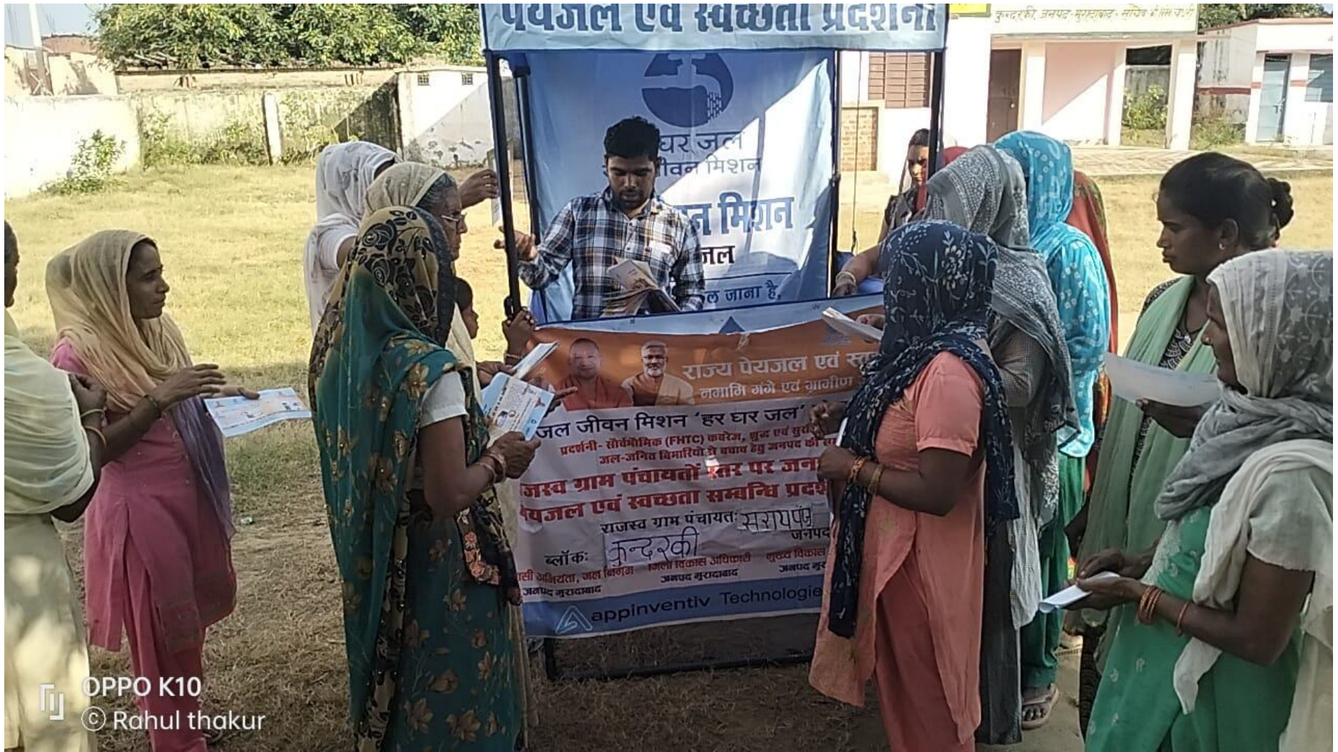
OPPO K10