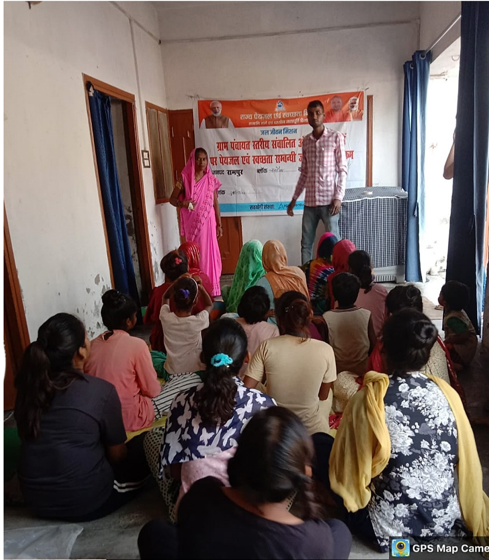
Haryal, Uttar Pradesh, India Unnamed Road, Haryal, Uttar Pradesh 244901, India Lat 28.689298° Long 79.063103° 30/09/23 03:45 PM GMT +05:30