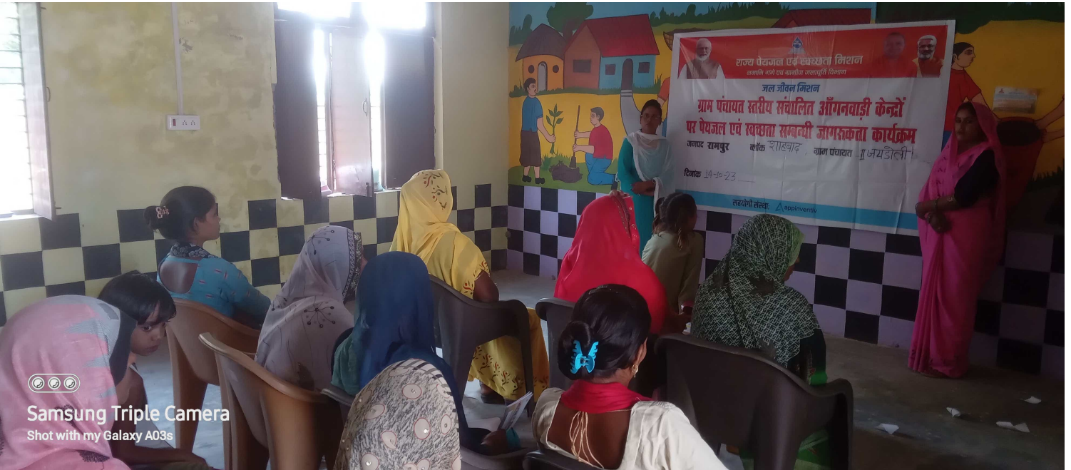
Samsung Triple Camera Shot with my Galaxy A03s