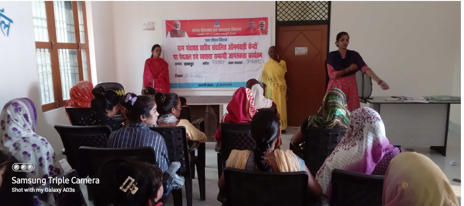
Samsung Triple Camera Shot with my Galaxy A03s