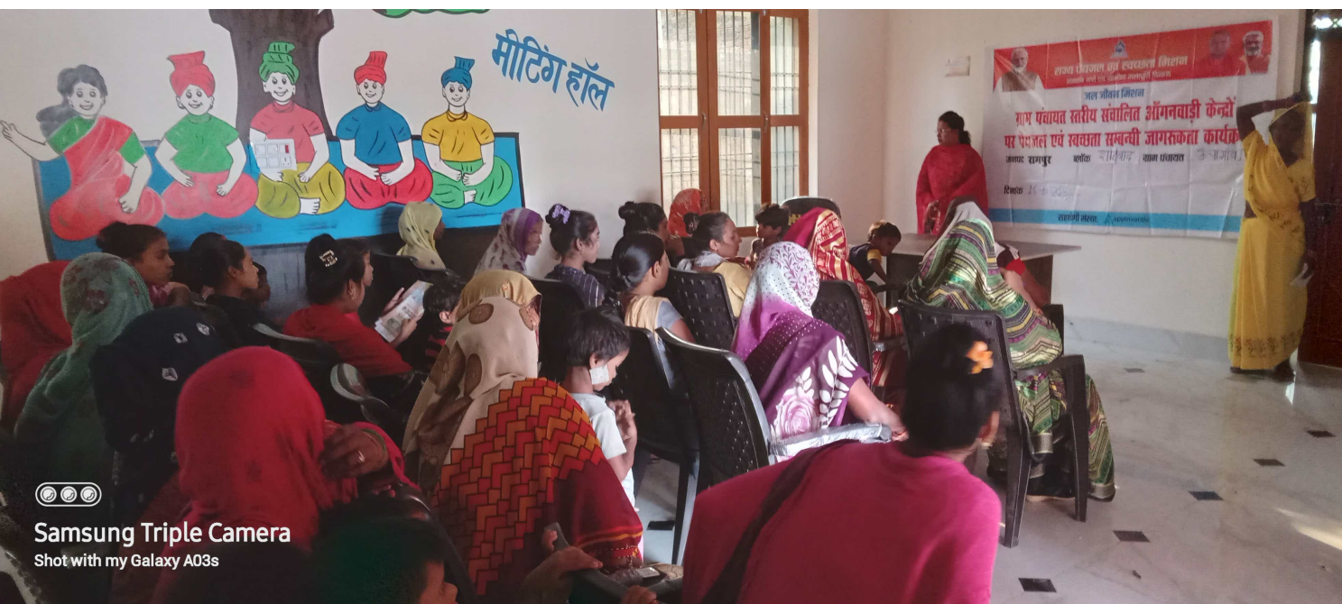
Samsung Triple Camera Shot with my Galaxy A03s