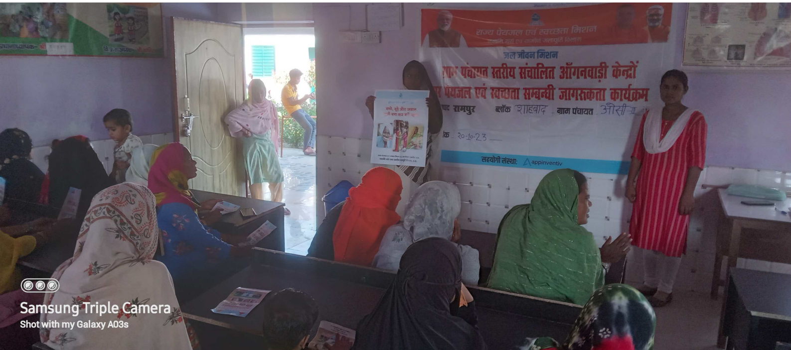
Samsung Triple Camera Shot with my Galaxy A03s