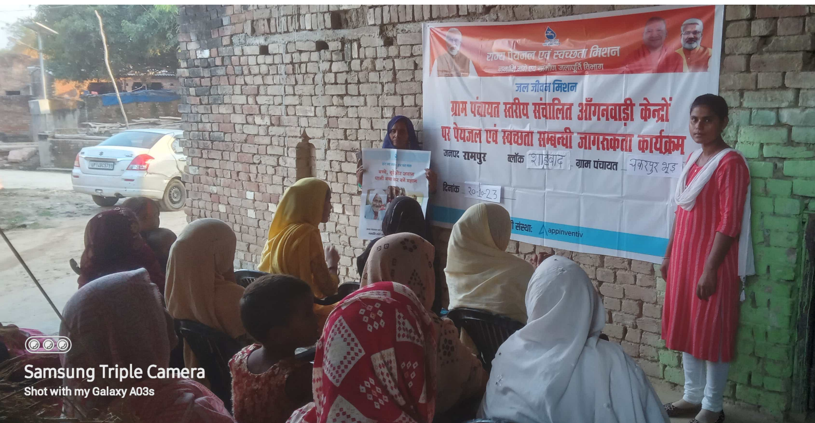
Samsung Triple Camera Shot with my Galaxy A03s