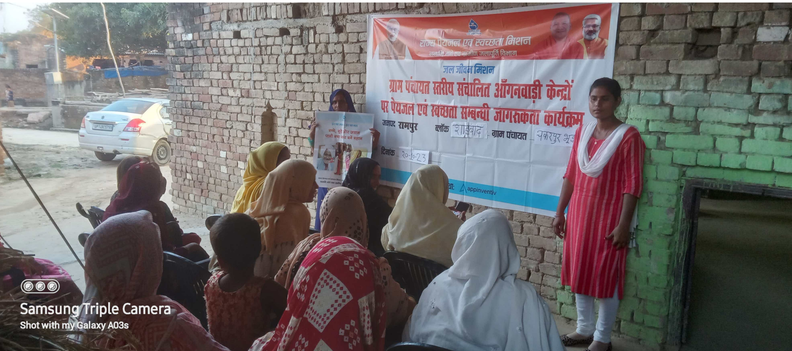
Samsung Triple Camera Shot with my Galaxy A03s