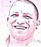
योगी आदित्यनाथ मुख्यमंत्री, उत्तर प्रदेश