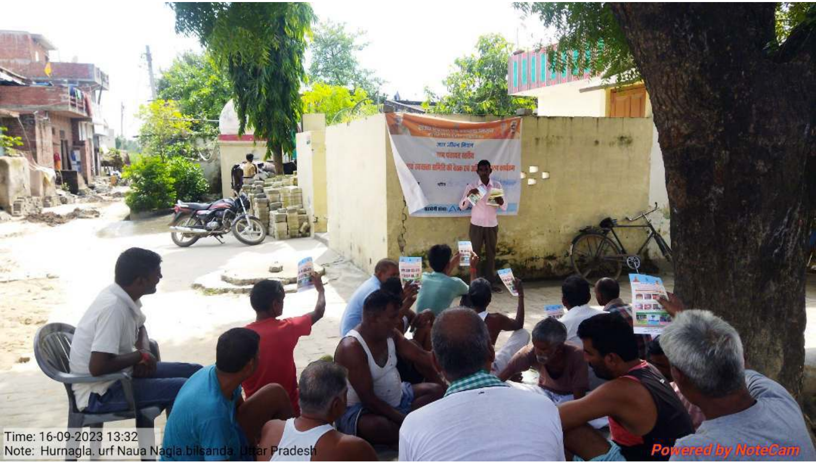
Time: 16-09-2023 13:32 Note: Hurnagla, urf Naua Nagla, bilsanda, Uttar Pradesh