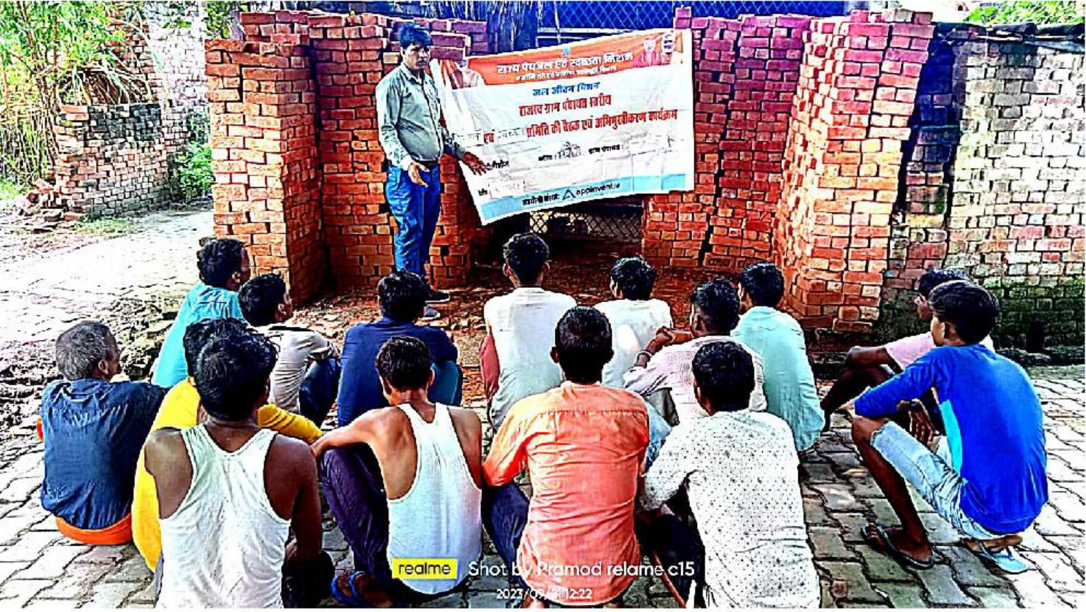
realme relame c15 2023/07/28 12:22