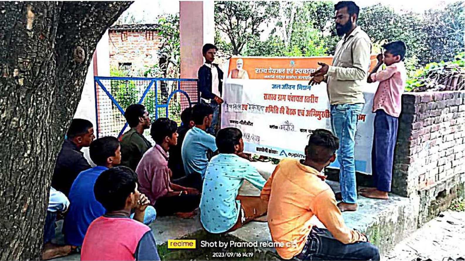
realme Shot by Pramod relame c/s 2023/09/16 14:19