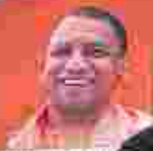
श्री. योगी आश्रित्य मुख्यमंत्री (उ.प्र.)

राज्य पंचजल एवं स्वच्छता मिशन कमलसि गंजो एवं जालीय जलापूर्ति विभाग