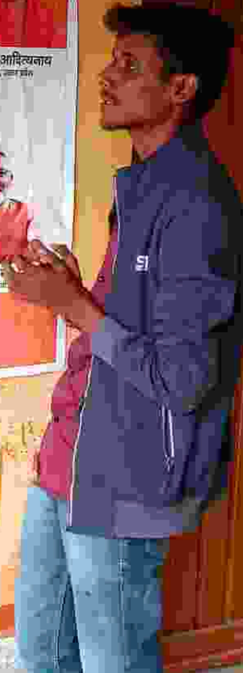
मा. योगी आदित्यनाथ