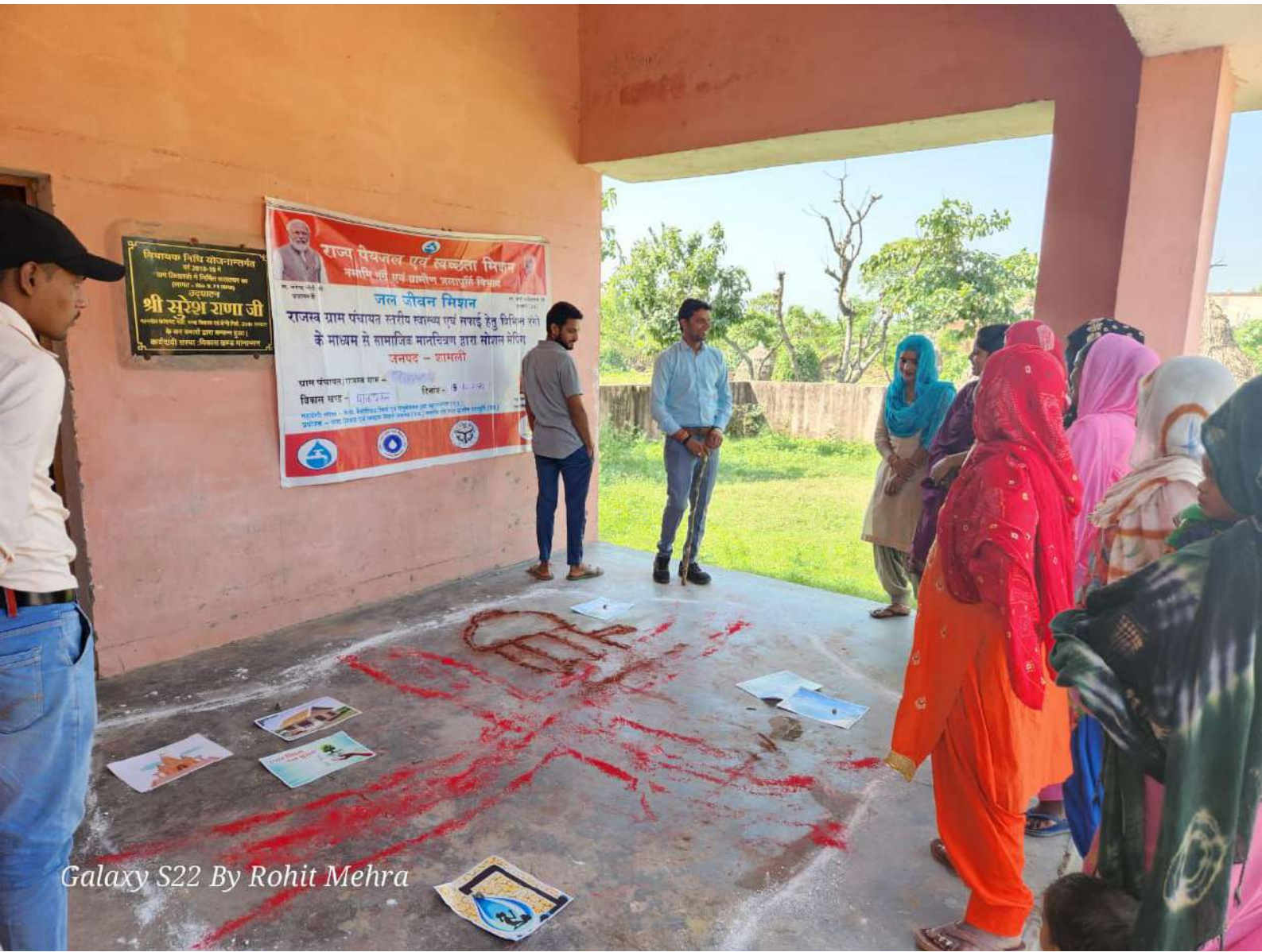
Galaxy S22 By Rohit Mehra