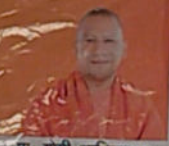
मा. योगी आदित्यनाथ मुख्यमंत्री, उत्तर प्रदेश