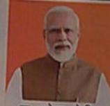
मा. नरेन्द्र मोदी प्रधानमंत्री