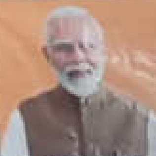
मा. नन्द मोदी प्रधानमंत्री