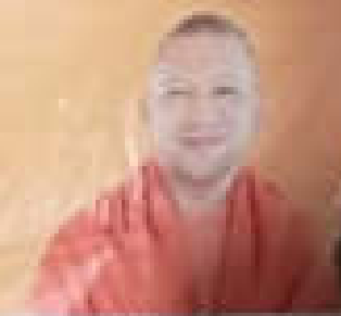
मा. योगी अदितिबाबू मुख्यमंत्री, उत्तर प्रदेश