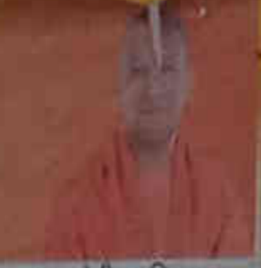
मा. योगी आदित्यनाथ मुख्यमंत्री, उत्तर प्रदेश