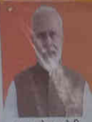
मा. नरेन्द्र मोदी प्रधानमंत्री