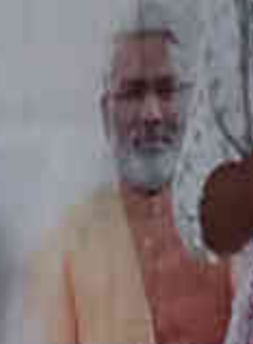
मा. स्वतंत्र देव जल, शक्ति मंत्री