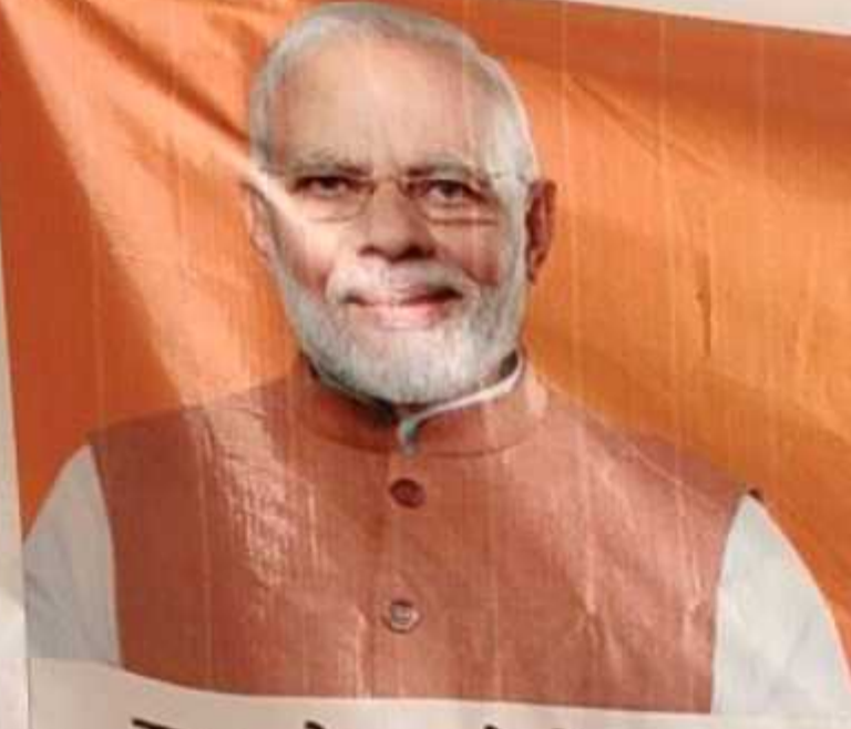
मा. नरेन्द्र मोदी प्रधानमंत्री