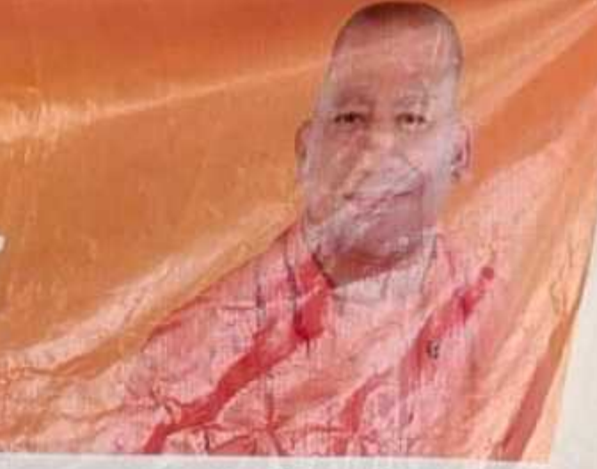
मा. योगी आदित्यनाथ मुख्यमंत्री, उत्तर प्रदेश