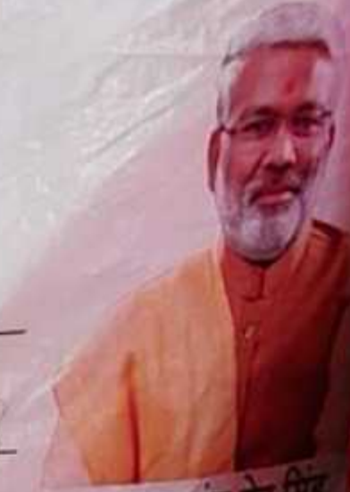
मा. स्वतंत्र देव सिंह जल शक्ति मंत्री, UP