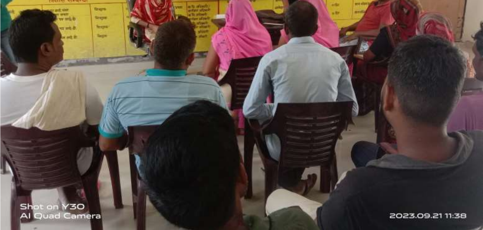
Shot on Y30 AI Quad Camera