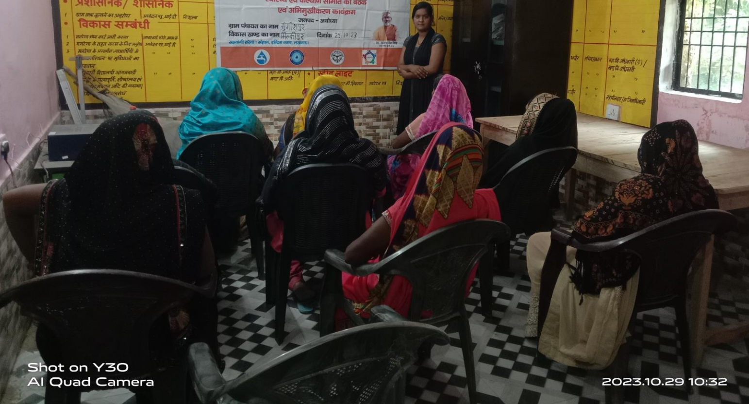
Shot on Y30 AI Quad Camera