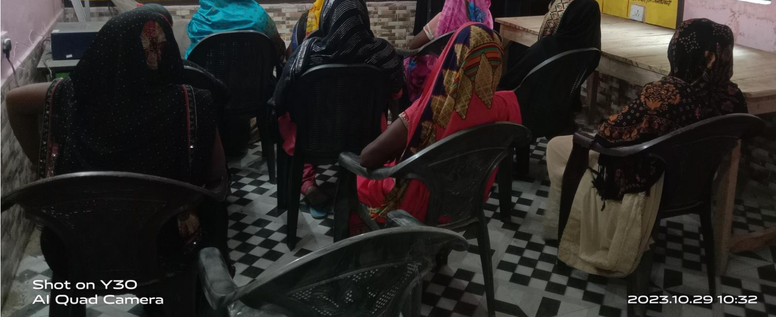
Shot on Y30 AI Quad Camera

एक महिला प्रस्तोता, जो बैठक में खड़ी है।