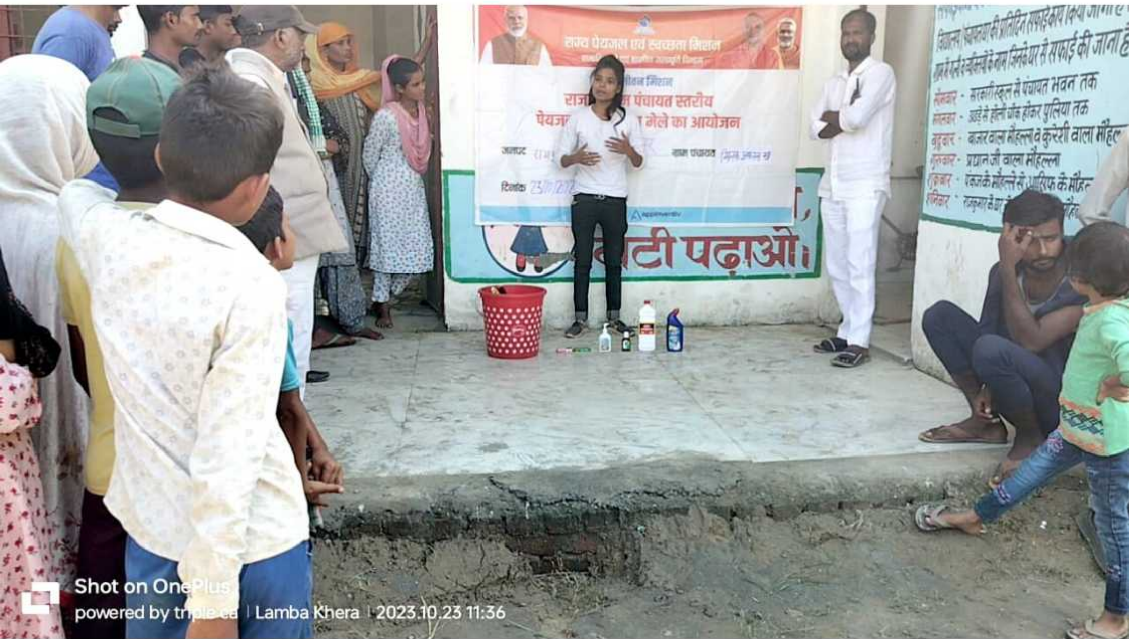
Shot on OnePlus powered by triple camera | | 2023.10.23 11:36